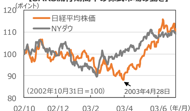
【SARS流行期間中の株式市場の動き】