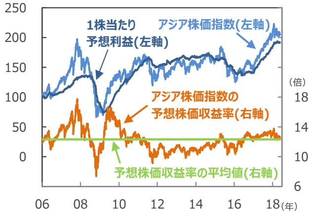
(ポイント) 【アジア株価指数と予想株価収益率】

(注1) データは2006年1月2日～2018年5月23日。1株当たり予想利益は5月22日まで。アジア株価指数、1株当たり予想利益は2006年1月2日=100。 (注2) 予想株価収益率 = 株価 ÷ 1株当たり予想利益。1株当たり予想利益は12カ月先ベース、I/B/E/S予想。米ドルベース。予想株価収益率の平均値は2006年1月2日～2018年4月30日。