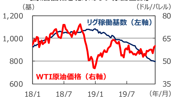
【原油価格と北米のリグ稼働基数】

(注) データは2018年1月5日～2019年12月13日。週次データ。WTIは原油価格の代表的な指標のひとつ。