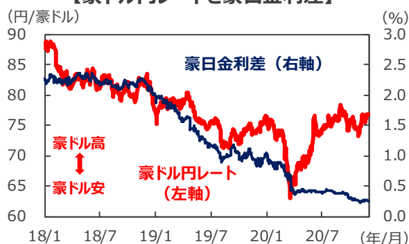
【豪ドル円レートと豪日金利差】

(注) データは2018年1月1日～2020年12月1日。豪日金利差は3年国債利回りの差。