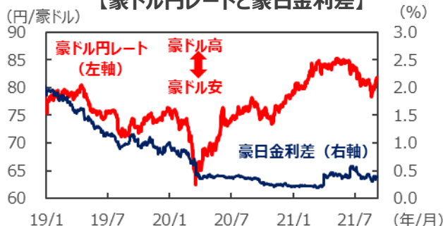
【豪ドル円レートと豪日金利差】