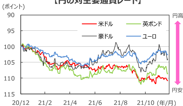
【円の対主要通貨レート】

(注) データは2020年12月31日～2021年12月24日。 昨年末を100として指数化。逆目盛。