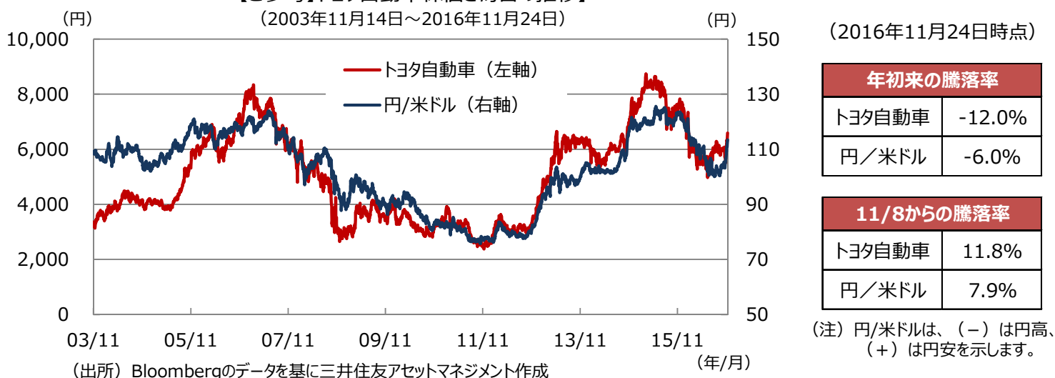
【ご参考】トヨタ自動車株価と為替の推移

※上記の見通しは当資料作成時点のものであり、将来の投資成果および市場環境の変動等を示唆あるいは保証するものではありません。今後、予告なく変更する場合があります。