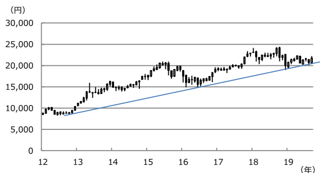
【図表2：日経平均株価の下値支持線】

(注) データは2012年1月から2019年9月。下値支持線は2012年10月安値と2016年6月安値を結んだ線。